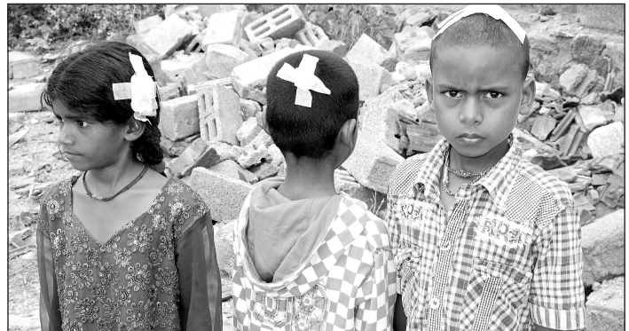
தீண்டாமை சுவர் இடிந்து விழுந்து படுகாயத்துடன் தாயை இழந்து பரிதவிக்கும் குழந்தைகள்