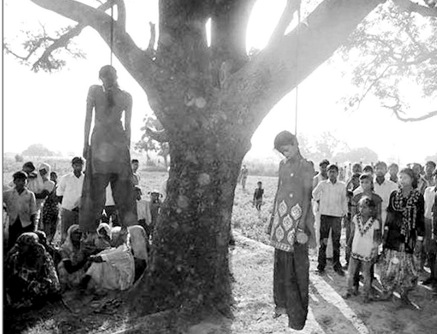
உ.பி.யில் 2 தலித் சிறுமிகள் பாலியல் வன்கொடுமை செய்து மரத்தில் தூக்கில் தொங்கவிட்ட கொடுமை

27-5-2014 அன்று உத்தரபிரதேச மாநிலத்தை சேர்ந்த தலித் சிறுமிகள் 2 பேரை பாலியல் வன்கொடுமைக்கு உள்ளாக்கி படுகொலை செய்த செய்தி நாட்டையே உலக்கியது. அதை தொடர்ந்து தமிழகத்திலும் உ.பி.யை போன்று சேலம் மாவட்டம் வாழ்ப் பாடி அருகே சென்றாயன் பாலையத்தில் கடந்த பிப்ரவரி மாதம் 10 வயது சிறுமியை 5 பேர் கொண்ட கும்பல் பாலியல் பலாத்காரம் செய்து கொன்று மரத்தில் கயிறு கட்டி தொங்க விட்டுள்ளனர் மனித மிருகங்கள். இந்த கொரத்தை செய்த ஈன பிறவிகள் 5 பேரும் இப்போது ஊருக்குள் ஜாலியாக உலா வருகிறார்கள். இச் சம்பவத்தால் பாதிக்கப்பட்ட குடும்பம் அந்த ஊரில் வாழ முடியாமல் அவமானப்பட்டு வெளியேறி சேலம் ஆத்தூர் அருகே வாழ்கின்றனர். பணத்திற்காக எத்தனையோ வழக்குகளில் பொய் சாட்சிகளை தயார் செய்து நிரபராதிகளை சிறையில் தள்ளும் காவல்துறை அதே பணத்திற்காக ஊரின் நடுவே நடந்த இந்த கொரத்திற்காக யாரும் சாட்சி சொல்ல வரவில்லை என்று காரணம் கூறி 3 மாதங்கள் ஆகியும் அந்த 5 பேருக்கு எதிராக குற்ற பத்திரிகை தாக்கல் செய்யவில்லை. அதையே காரணம் காட்டி அந்த ஈனப்பிற்பி 5 பேரும் நீதிமன்றத்தில் ஜாமீன் வாங்கி விட்டார்கள்.