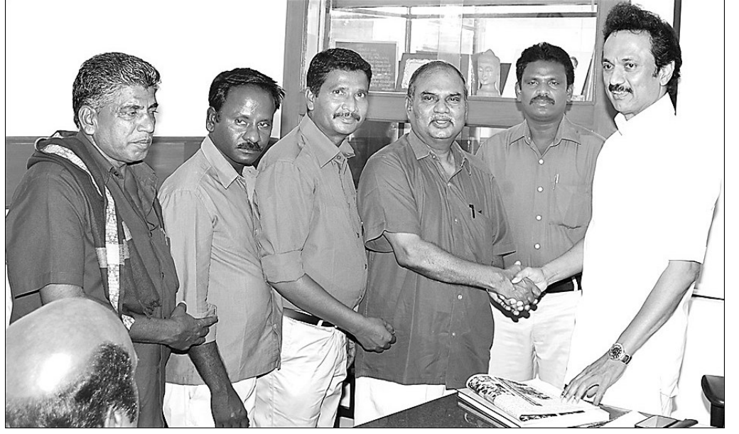
நடந்த முடிந்த 2014 நாடாளுமன்ற தேர்தலில் திமுக கூட்டணிக்கு தேர்தல் களப்பணியாற்றிய பேரவையினரை பாராட்டிய தளபதி ஸ்டாலின்