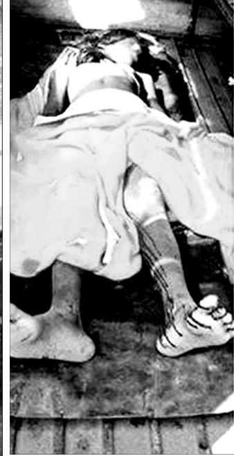
சேலத்தில் பாலியல் வன்கொடுமையால் இறந்த 10 வயது சிறுமியும் பாலியல் வன்கொடுமை செய்த 3 மனித மிருகங்கள்.