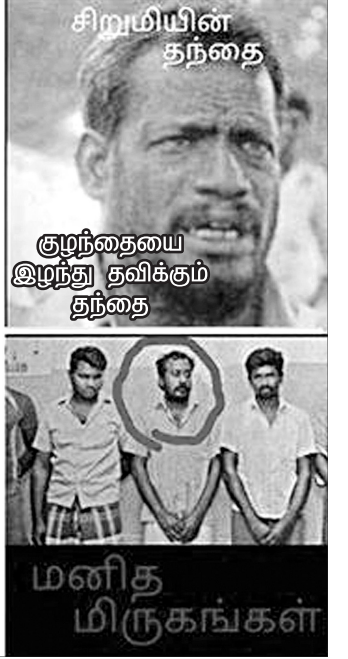
சிறுமியின் தந்தை குழந்தையை இழந்து தவிக்கும் தந்தை மனித மிருகங்கள்